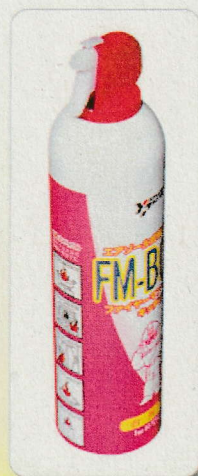
■対象商品 (自主回収) 【FMボーイK】