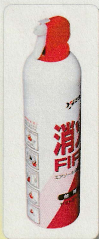
■対象商品 (自主回収) 【ヤマトボーイKT】

弊社では、これまで皆様のご協力を得て自主回収を推進してまいりました。しかし、2017年で製造から15年が経過しておりますが、まだ多数の消火具が残っている可能性が高く、事故防止を図る観点から、今後とも皆様方のご協力を得て一層の回収・廃棄に努めてまいります。