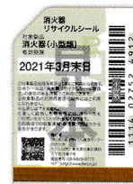
既販品用シール(見本)